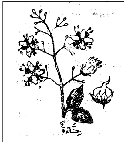
Rajah 1: Ilustrasi pohon inai dalam kamus.

Berkaitan al-Katam , al-Fayyumi mengatakan bahawa dalam kitab al-Lisan dan kitab-kitab perubatan, al-Katam (الكَتَمُ) merupakan satu jenis tanaman gunung yang terdapat di daerah Yaman. Ia mengeluarkan warna hitam seakan-akan kemerahan. 8 Disebutkan di dalam kitab 'Awn al-Ma'bud , mewarnakan rambut dan janggut ( khadab ) dengan gabungan kedua-duanya (inai dan katam) akan mengeluarkan warna di antara hitam dan merah. Inilah yang menjadi amalan Abu Bakar yang sering melakukan khadab dengan gabungan inai dan katam sepertimana hadis: 9